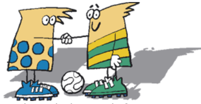
Ich verhalte mich fair!