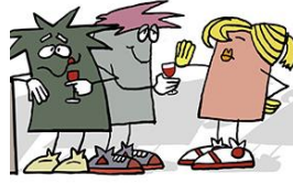
Ich verzichte auf Alkohol!