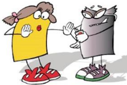
Ich verzichte auf Tabak!